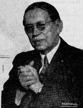
Don Roberto Brenes Mesén